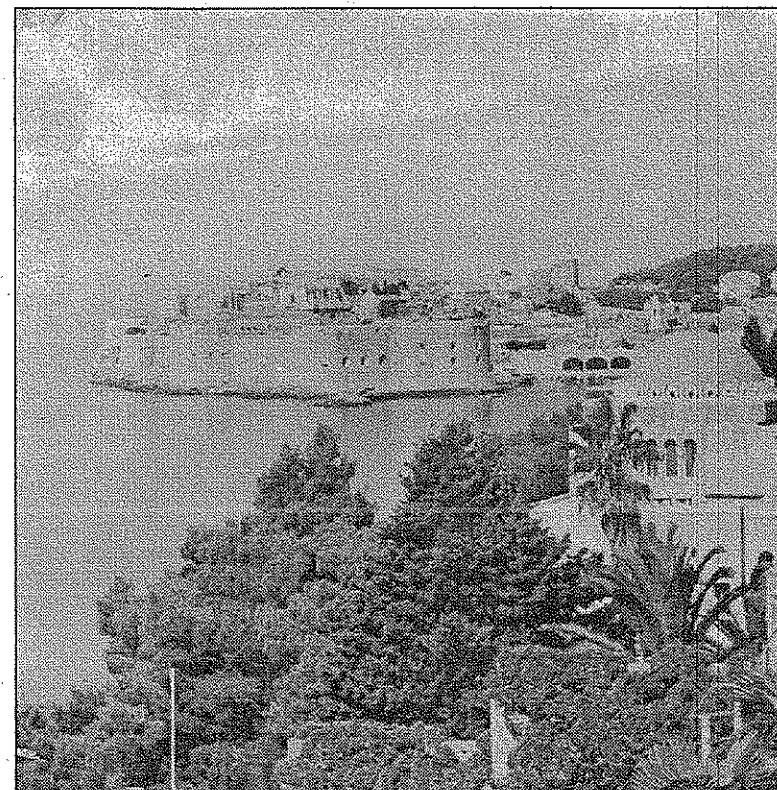
ПОЧЕТАК ЗАЈЕДНИЧКОГ РАДА: Дубровник

културе, које су одабрале националне радионице одржане у Хрватској, Србији, Македонији и Црној Гори. Фокусирана је припрема трогодишњег стратешког плана развоја и јачања организација у култури. Тема радионице била је: „Дилеме културне политике у југоисточној Европи“ које су из-