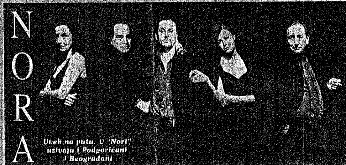
Uvek na putu. U "Nori" uživaju i Podgoričani i Beogradani