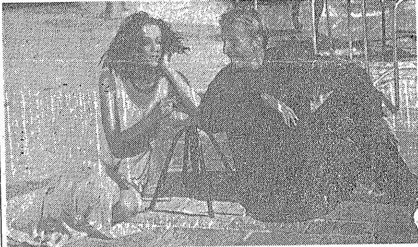
ИЗ ПРЕДСТАВЕ „БАНОВИЋ СТРАХИЊА”

– Представу смо брзо урадили, за само четири недеље. Текст Борислава Михајловића Михиза је рационалан а ми смо покушали да га прочитамо на један ирационалан начин. Тражили смо неке нове слојеве. Амбијент је овде, на тврђави, феноменалан, заљубио сам се у њега и кад сам радио адаптацију стално сам мислио на ову тврђаву. Такође морам да кажем, а то није из куртоазije, да дуго писмо имали овакву сјајну екипу глумаца. Као редитељ направио сам само добру монтажу текста, па је трећи чин постао први, промената сам чинове и кренуло се од сцене суђења. Верујем да би се и Михизу једно овакво екстремно тумачење допало. Он ми је у једном разговору рекао: „Ради